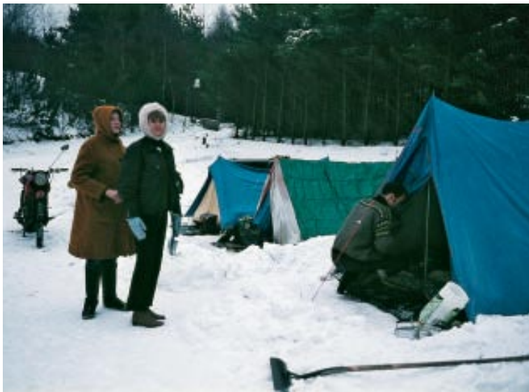
Krakær Træf i 1971. Navnet stammer fra en campingplads på Mols, hvor klubbens første vinter-teltræf fandt sted.