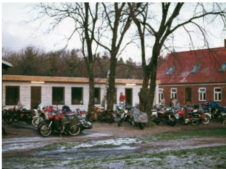
I dens storhedstid blev der kæmpet bravt om pokalerne og kørt utallige kolde december-kilometer i forbindelse med den årlige Julezielfahrt, der i mange år havde mål i Voerså syd for Sæby. Her en del af de deltagende maskiner før starten på hjemturen en søndag i 70'erne.

Orienteringsløbene er nu gået til de evige løbsruter, men Julezielfahrten eksisterer endnu i modereret form. I stedet for o-løbene afholder vi hvert år i september en Høstfest med indlagte sjove konkurrencer,