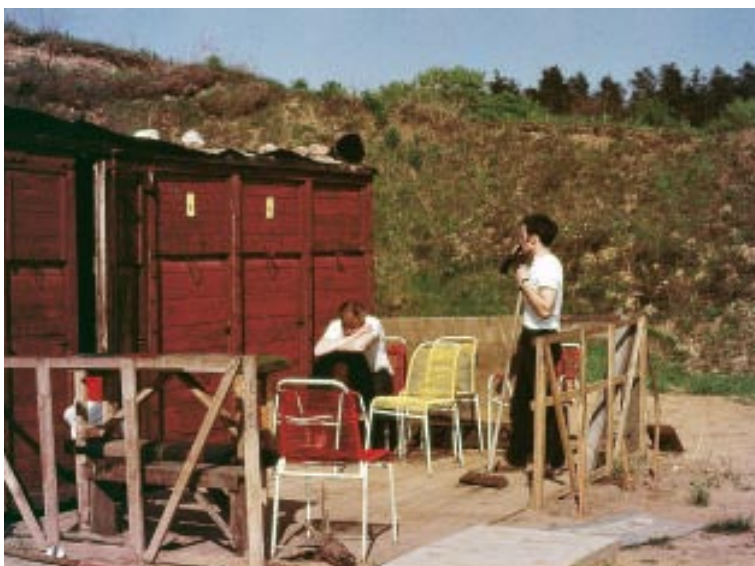
Hule nummer 2 blev bygget i 1969 i en nedlagt grusgrav ved Sabro vest for Århus. Her ligger Hulen stadig, men nu i en noget større og finere udførelse, og på det seneste er der sågar blevet indlagt el.