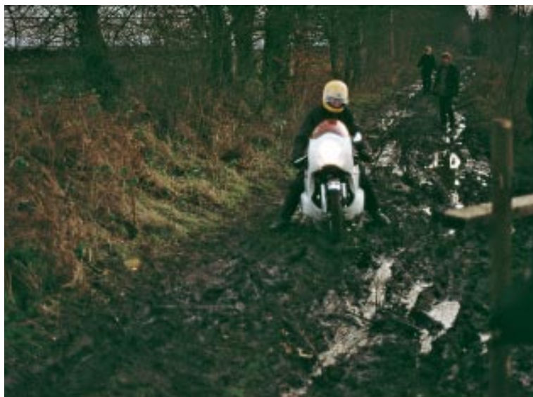
YCA's o-løb i 70'erne var ikke altid lige lette at komme igennem, da der blev kørt på almindelige gadecykler.

Septemberkåsan var opkaldt efter det svenske November-kåsan, som var et dag- og natløb på meget dårlige veje. Septemberkåsans veje var dog af en noget bedre beskaffenhed end de svenske ditto, men der var stadigvæk tale om en dag- og en natetape.