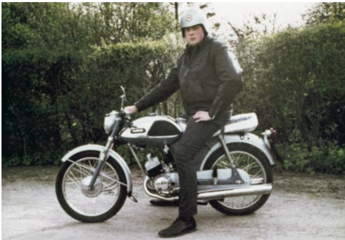
En stolt ejer med sin nye Yamaha i maj 1966.

cykler, det var ellers ikke så almindeligt på det tidspunkt. Vi mødtes så vidt muligt om torsdagen til klubaften – vi var vel på det tidspunkt 10-15 medlemmer. Der blev afholdt en række filmaftener, hvor der blev inviteret ikke-medlemmer, og derved fik vi en del nye hoveder i klubben.