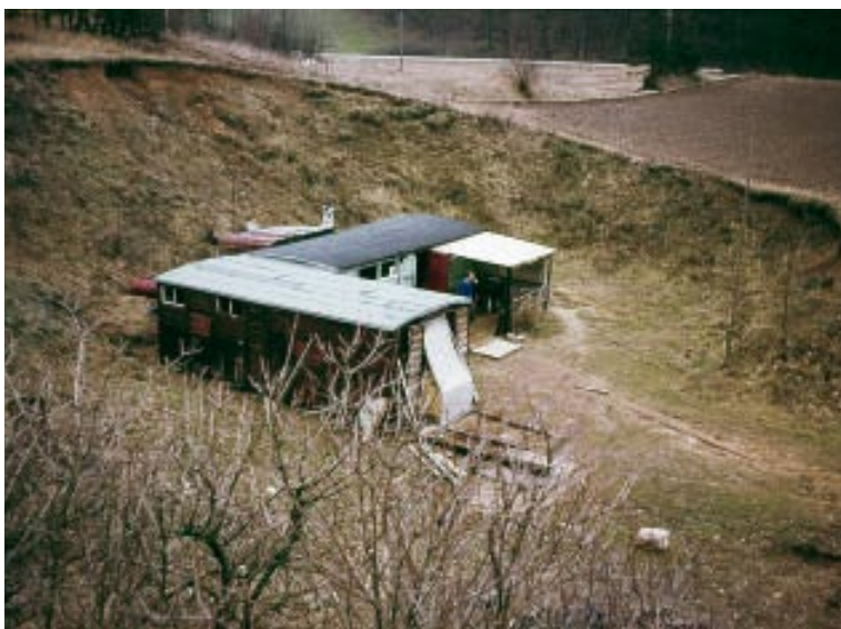
Hulen som den så ud i midten af 70'erne.